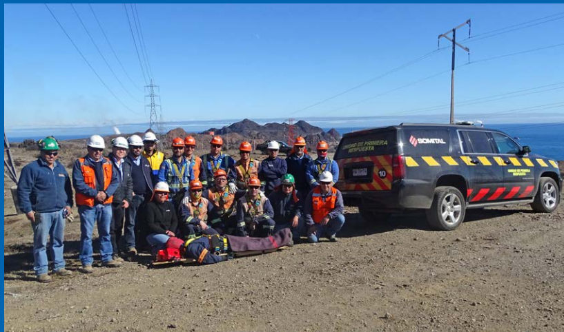
El equipo participó con entusiasmo y profesionalismo.

Por un programa establecido por nuestro mandante, una vez al año realizamos un ejercicio de simulacro, para refrescar los conocimientos y evaluar la práctica de nuestros colaboradores en situaciones de emergencia, en ese contexto efectuamos el simulacro de rescate en altura, realizado en la Línea 2x220 Kv. Guacolda – Maitencillo, estructura N°22, el jueves 5 de julio de 2018. La actividad contó con la participación de la totalidad de los colaboradores del contrato de mantenimiento, más los elementos y equipos de uso cotidiano en la actividad de lavado de aislación.