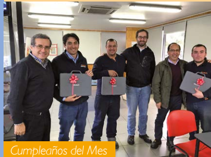
Cumpleaños del Mes