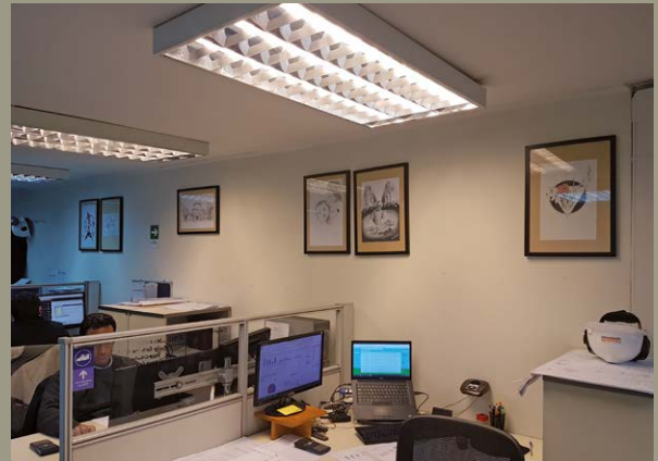
Felicidades a todos los participantes de esta iniciativa.