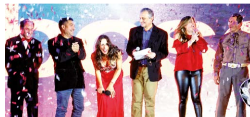
Celebración aniversario Bbosch Santiago.