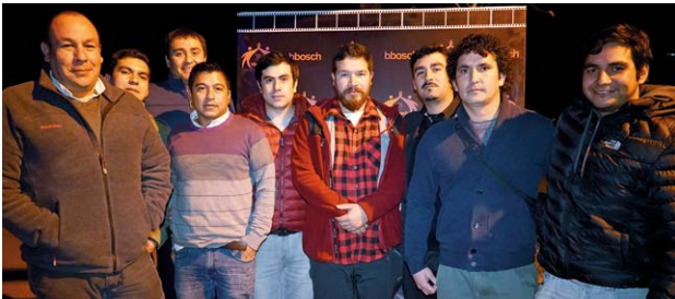
Contrato Codelco Andina, cinco años sin accidentes CTP.