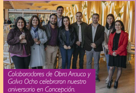
Colaboradores de Obra Arauco y Galva Ocho celebraron nuestro aniversario en Concepción.