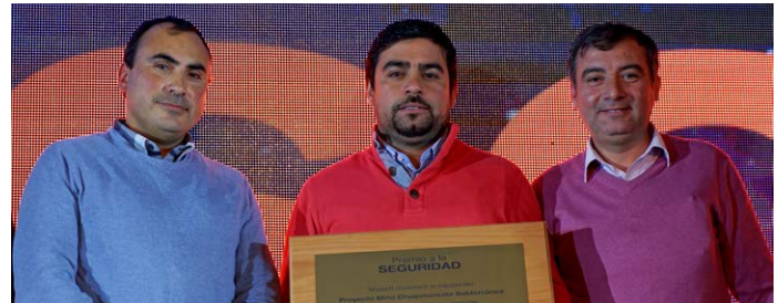
Proyecto Mina Chuquicamata Subterránea, 508.000 HH sin accidentes CTP.