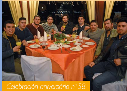
Celebración aniversario n° 58.