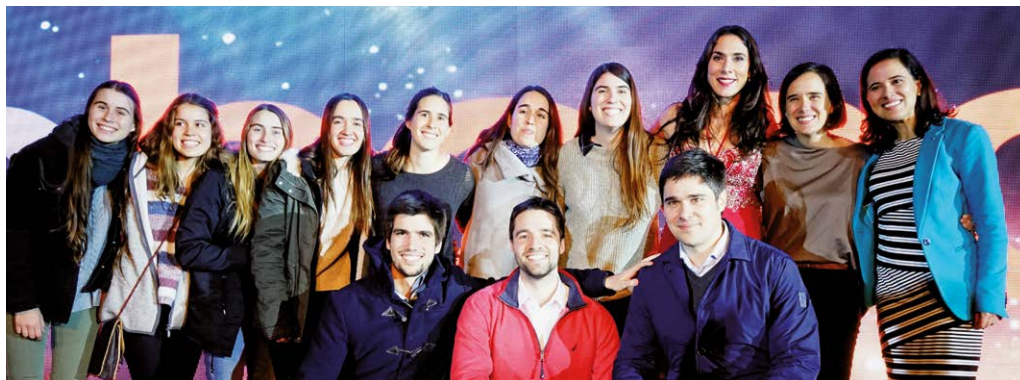
Estamos felices de festejar juntos 58 años.

“Hay un típico dicho en las empresas familiares, que me imagino muchos de ustedes ya conocen: la primera generación construye la empresa, la segunda la hace crecer y la tercera la destruye. No se preocupen, que como tercera generación no tenemos esa intención, al contrario, nos gusta y queremos seguir siendo una familia empresaria. Tenemos muchas ganas de aportar. Estamos muy orgullosos de lo que han creado y de cómo Bosch es un referente en valores. Lo bueno en una empresa familiar, es que hay muchos espacios de donde aportar, a mí por ejemplo me toca desde la junta de accionistas. A otros les toca desde el directorio, la administración e incluso desde la fundación Carmen Bosch Ostalé, que también está ligada a la empresa.