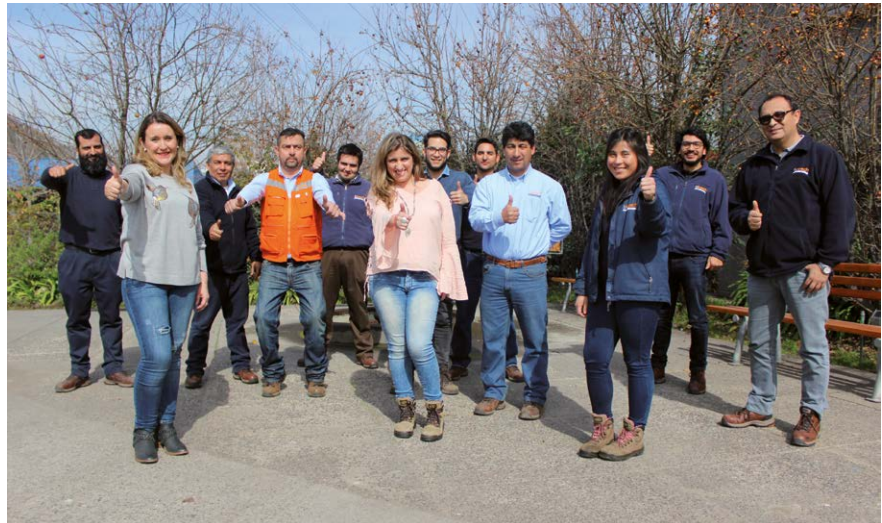
El Programa Líderes nació para fortalecer la productividad en los equipos de trabajo.

La especialista agrega, que este traspaso de conocimiento es realizado por los mismos trabajadores, generando una sinergia interesante entre las personas antiguas y colaboradores nuevos, los que aprenden a través de ejemplos e historias que ellos mismos relatan.