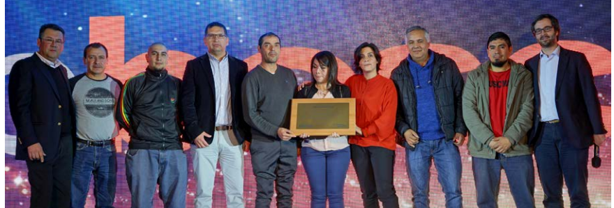
Equipo Operaciones Planta Buenaventura, sus prácticas y acciones han permitido reducir significativamente la accidentabilidad.

Bbosch ha destacado a 3 equipos por promover prácticas y ambientes de trabajos resilientes y seguros. Agradecemos a todos los involucrados, por esta conducta que sin duda representa un fuerte compromiso con el trabajo responsable y seguro; una de las directrices fundamentales de nuestra empresa. Felicitaciones por este merecido reconocimiento, que debe motivar a todos los colaboradores a trabajar siempre en la senda de la seguridad.