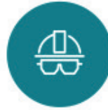
Seguridad y Salud