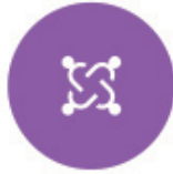
Diversidad e Inclusión