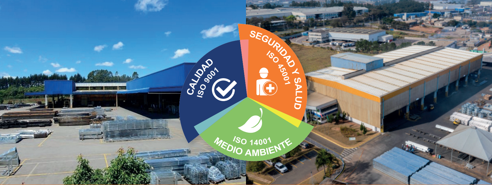
Planta Farroupilha, Brasil