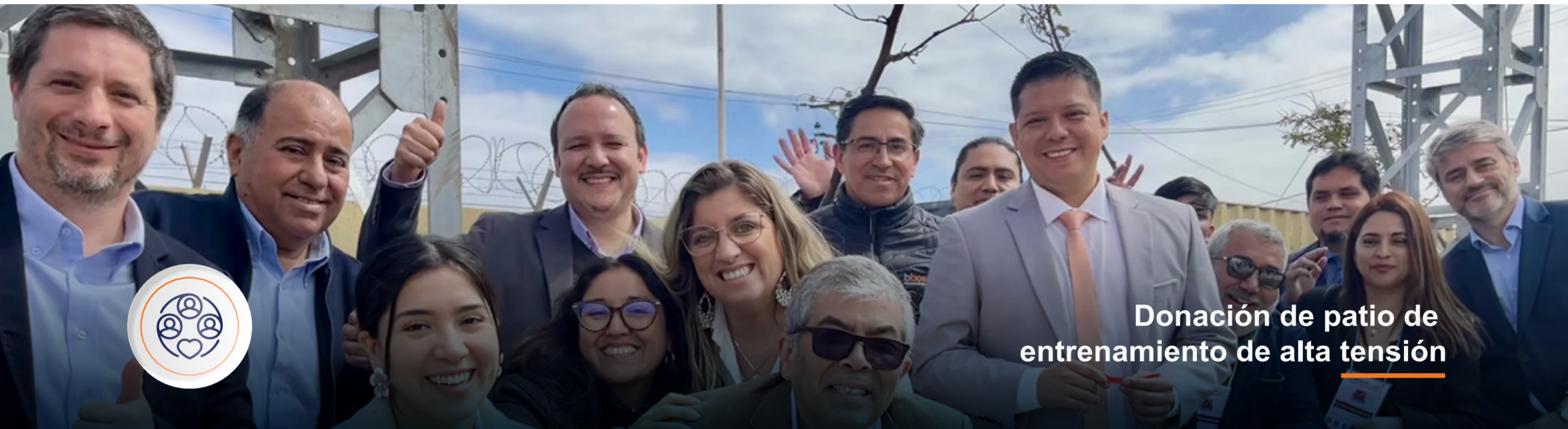
Donación de patio de entrenamiento de alta tensión